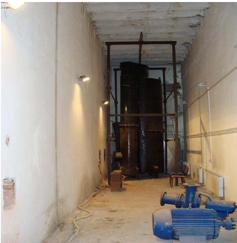
Слика 3. Просторија у којој ће бити монтиран Први део инсталације са већ раније монтираним основним деловима

На слици 3 дат је изглед просторије са већ монтираним елементима у лабораторији за калибрацију протокомера и хидромашинске опреме.